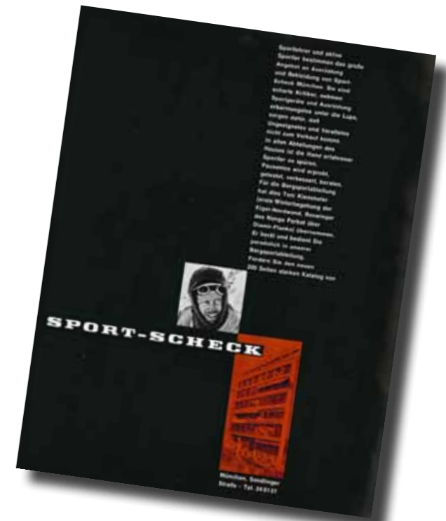
Alpinismus 10/63 Partner der ersten Stunde: SportScheck war als Unternehmen schon in der ersten Ausgabe unseres Magazins vertreten.

Die Mitarbeiter von SportScheck, Verlag und Redaktion und deren Angehörige können nicht teilnehmen. Die Gewinner werden in der Dezember-Ausgabe genannt und zusätzlich per Post benachrichtigt. Der Rechtsweg ist ausgeschlossen. Mit der Teilnahme an diesem Gewinnspiel erklären Sie sich damit einverstanden, dass Ihnen der Olympia-Verlag und SportScheck per Post, Telefon oder E-Mail Informationen über eigene Medien-Angebote zukommen lassen. Ihre Daten werden nicht an Dritte weitergegeben. Wenn Sie mit dieser Nutzung der Daten nicht einverstanden sind, so teilen Sie dies dem Olympia-Verlag in Ihrer Zusendung mit. Dieses Einverständnis können Sie jederzeit widerrufen.